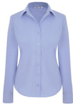
Un chemisier ¢20.000.00