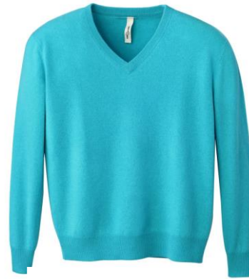
Un pull-over ¢18.000.00