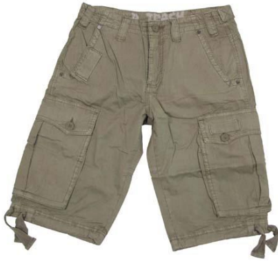
Un bermuda ¢15.000.00