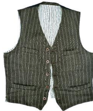
Un gilet ¢30.000.00